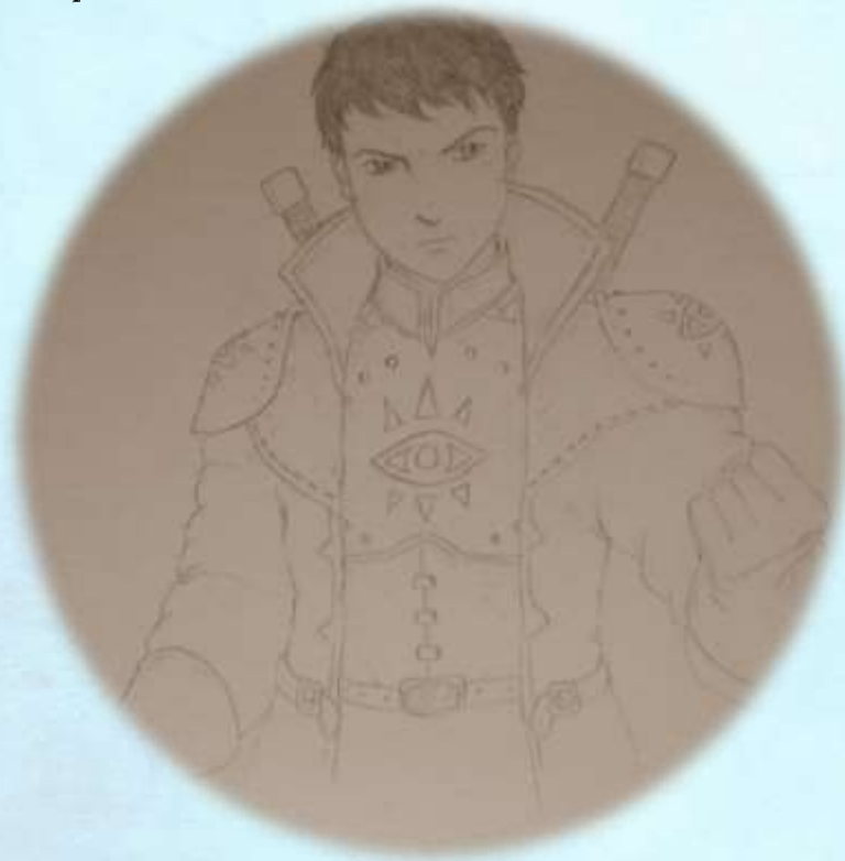
Tarisan, Inquisitor für der Vangaras aus Mertalia.

Am nächsten Morgen laufen dann in ganz Dragorea Kinder aufgeregt zum Kamin oder zur Feuerstelle ihres Hauses und schauen nach, ob der Krampus in der Nacht da war. Denn wenn er nicht da war und die Süßigkeiten noch daliegen, dann gehören sie ihnen und können von ihnen genüsslich verspeist werden.